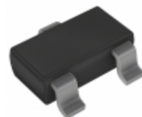
AZ23C39-7 Diodes Incorporated DIODE ZENER ARRAY 39V SOT23-3