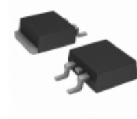
MBRD330TR SMC Diode Solutions DIODE SCHOTTKY 30V 3A DPAK