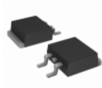
MBRD330TRR Vishay Semiconductor Diodes Division DIODE SCHOTTKY 30V 3A DPAK