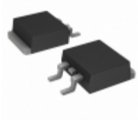
MBRD330TRR Vishay Semiconductor Diodes Division DIODE SCHOTTKY 30V 3A DPAK