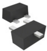
DRC9124T0L Panasonic Electronic Components TRANS PREBIAS NPN 125MW SSMINI3