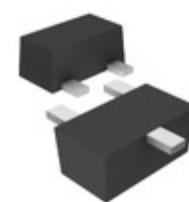
DRC9123J0L Panasonic Electronic Components TRANS PREBIAS NPN 125MW SSMINI3