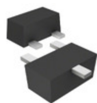
DRC9144E0L Panasonic Electronic Components TRANS PREBIAS NPN 125MW SSMINI3