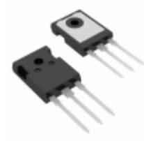
IXGH28N60B3D1 IXYS IGBT 600V 66A 190W TO247AD