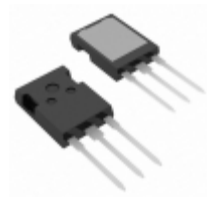
IXFX420N10T IXYS MOSFET N-CH 100V 420A PLUS247