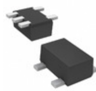
DMC5610M0R Panasonic Electronic Components TRANS 2NPN PREBIAS 0.15W SMINI5