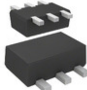
DMC564000R Panasonic Electronic Components TRANS PREBIAS DUAL NPN SMINI6